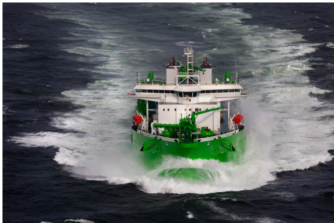
DEME's sleepopperzuiger 'Congo River'

Nog in Nigeria heeft Nigerian Ports Authority een havensleepdienstcontract voor de haven van Onne toegewezen aan CTOW. Dit contract garandeert havensleepdiensten aan alle gebruikers van de haven en dit voor een periode van 10 jaar. DEME is hoofdaandeelhouder van CTOW; mede-eigenaars zijn Multraship en Herbosch Kiere.